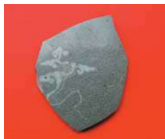
高麗青磁梅瓶 13世紀 北区 天満本願寺跡

港町・渡辺津と四天王寺を中心に、発掘調査成果から鎌倉時代の大阪の様子を紹介します。