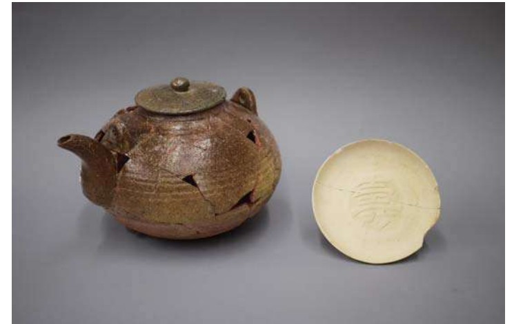
土瓶（薩摩焼か）と尾戸焼「寿」字文皿 18 世紀後半～19 世紀初 北区 中之島蔵屋敷跡（久留米藩）

大坂の町は大坂城の築城とともに整備されていきました。大坂城跡の北西部にある調査地では、豊臣期の城づくりや町の開発に必要な工具や都市住民の生活用具などを作るために鑄物師が住み、犁先や鍋釜を鑄造していたことがわかりました。江戸時代に入ると、中之島には各藩の蔵屋敷が建ち並び、周辺は米や物資を積んで行きかう船で賑わいました。出土した食器や生活用具には、国元の産品や珍しい品が含まれ、蔵屋敷での暮らしを生き生きと語ってくれています。