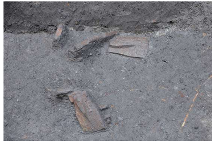
JR 森ノ宮駅近くで見つかった鍬の未完成品 紀元前 3～4 世紀 中央区 大坂城跡

弥生時代に関わる発掘調査成果を 2 例紹介します。いずれも水辺の微高地上にある、弥生時代中期（紀元前 3～4 世紀）に営まれたムラにかかわる成果です。中央区大坂城跡の下層には縄文～弥生時代の貝塚で有名な森の宮遺跡と一連の遺跡があります。弥生時代の鍬の未完成品は、溝のなかで水漬けで保管されていたもので、ムラのなかで木器の製作・加工が行われていたことがわかります。北区同心町遺跡では井戸や石器・土器が出土し、ムラが分布していたことがわかりました。