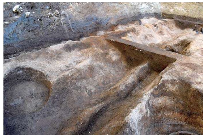
渡辺津推定地で見つかった溝 13～15 世紀 中央区 大坂城跡

北区豊崎遺跡では、古代の中津川に相当する大規模な流路が埋まったのち、平安時代には小規模な建物などが営まれました。室町時代には水溜や溝がつくられ、耕地開発が進んだようです。中央区大坂城跡の調査地は、中世の港町・渡辺津の一角にあたると考えられます。鎌倉～室町時代の陶磁器や土器、瓦を含む溝が見つかりました。瓦が見つかったことは、付近に瓦葺の仏教施設があったことを示唆しています。渡辺津にあった仏教施設「渡辺別所」と関係があるのかもしれない。