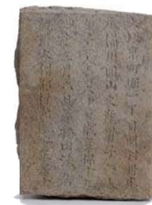
梅田墓の石製墓誌