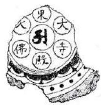
「東大寺大仏殿」銘軒丸瓦 13世紀 中央区 大坂城下町跡