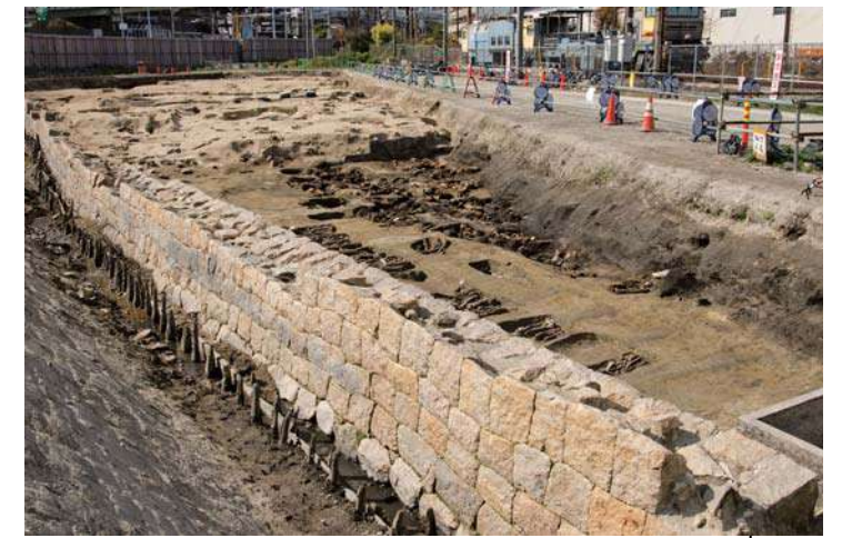
梅田墓の墓域とその周囲を区画する石垣 19 世紀中頃～後半 北区 大深町遺跡

「大坂七墓」の一つ「梅田墓」は、貞享年間（1684～1688）に現在の大阪駅南側にあった曾根崎村から「うめきた」周辺に移転されました。発掘調査では墓地の東部が見つかり、年代測定や文献資料から、1845 年ごろに拡幅・増設した部分だとわかりました。この場所では明治時代前半まで約 50 年間にわたり埋葬が行われ、土葬は約 1,700 体、火葬はその 10 倍ほどもあったと考えられています。出土した蔵骨器や石製の墓誌からは、梅田墓に葬られた人々の居住地などを知ることができました。