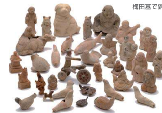
梅田墓で副葬された土人形