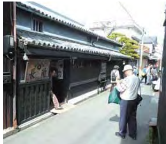
天保12年創業の醤油老舗「角長」の職人蔵

いつも乍らボランティアの方々、企画を世話して下さいました幹事の皆様たちにお礼を申し上げます。有難うございました。