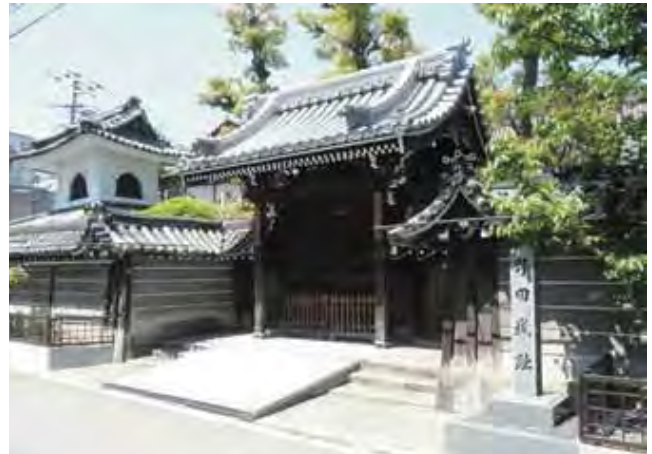
「野田城址」の碑がたつ極楽寺