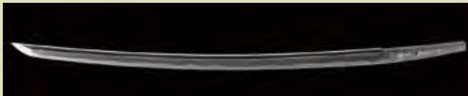
【国宝】 刀 名物 中務正宗(なかつかさまきむね) 鎌倉時代後期(14世紀)