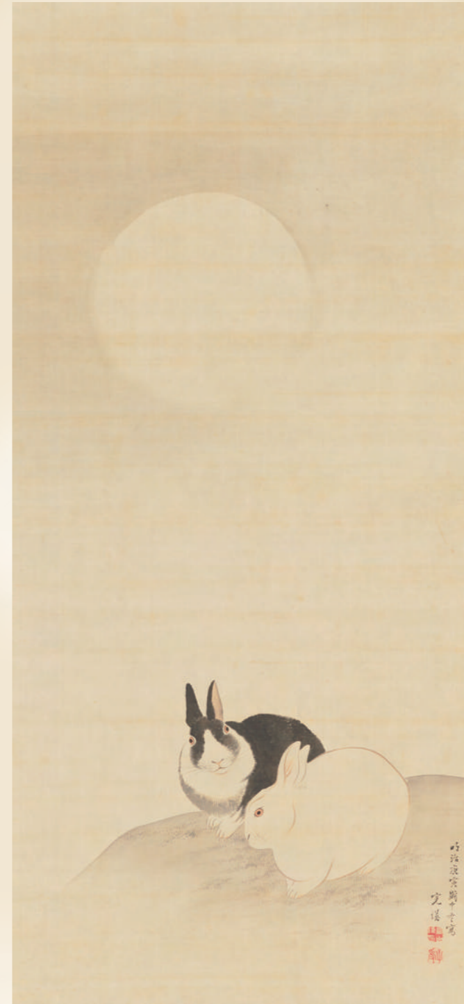
月下兔図 西山完瑛筆 明治23年(1890) 本館蔵(前田美希氏寄贈)

大きな月の下に2羽の白と黒の兔がいます。丸々とした愛らしい姿は、江戸時代の絵画に新風を吹き込んだ円山応挙の作品に学んだものです。作者の西山完瑛は大阪で活動し、絵画のみならず儒学や漢文学にも通じていました。本図は寅年の年11月の作と記されていますので、翌年の卯年のために描かれたのでしょうか。