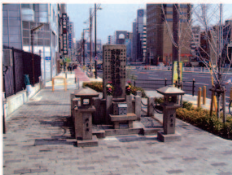
大正橋たもとの安政地震・津波記念碑

順番でおこなわれ、リアルにつくられた地震発生直後の街並みを再現した迫力のあるセットのなかで約80分を過ごしました。最後に各自終了証を渡され、解散しました。