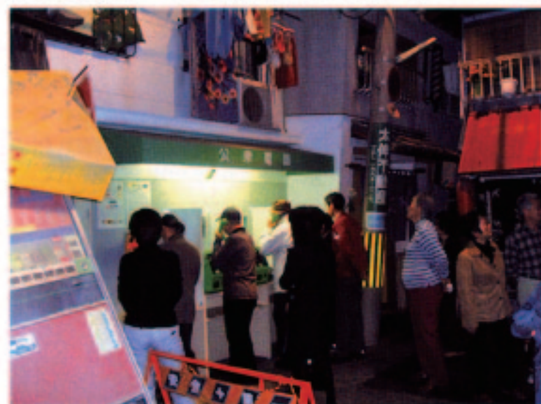
阿倍野防災センターでの119番通報体験

各自昼食ののち阿倍野で再集合し、14時30分に大阪市立阿倍野防災センターを訪ねました。まず学習ルームにて防災に関するガイダンス映像を見たのち、2班に分かれ、防災体験に向かった。体験はバーチャル地震体感、火災発生防止作業、煙中歩行、初期消火作業、119番通報、応急救護、震度7振動体験の