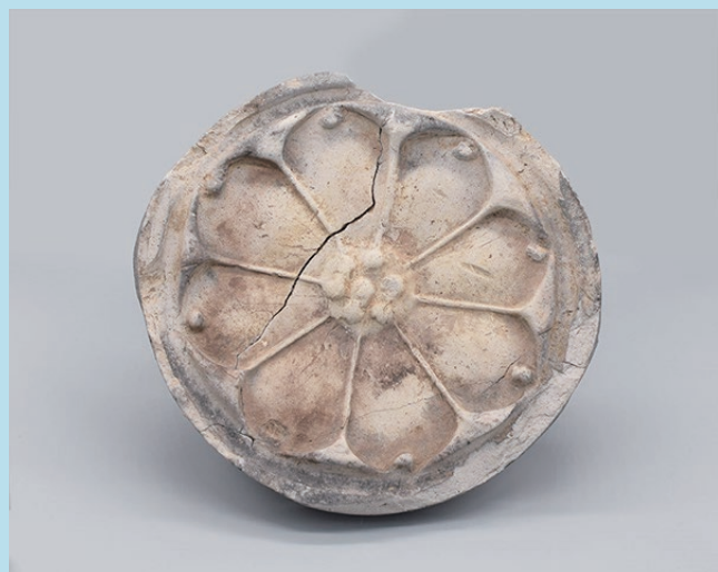
そ べん はち よう れん げ もん の き ま る が わ ら 難波宮造営以前の素弁八葉蓮華文軒丸瓦 難波宮跡出土 7世紀前葉 大阪市教育委員会蔵

難波宮の造営は、645年に始まる大化改新を契機として開始されます。それ以前の大阪には、難波津という港や四天王寺があり、大陸文化と接する場所でもありました。本資料は、のちに前期難波宮朝堂院ができるエリアで見つかりました。難波宮造営よりも前の7世紀前葉のもので、文様の型には四天王寺創建期の瓦と同じ ほん 範を用いています。一方、前期難波宮にあたる時期に大規模な宮殿 いたぶき の規模に見合った量の瓦は出土していないため、宮殿は板葺であったと推定されています。